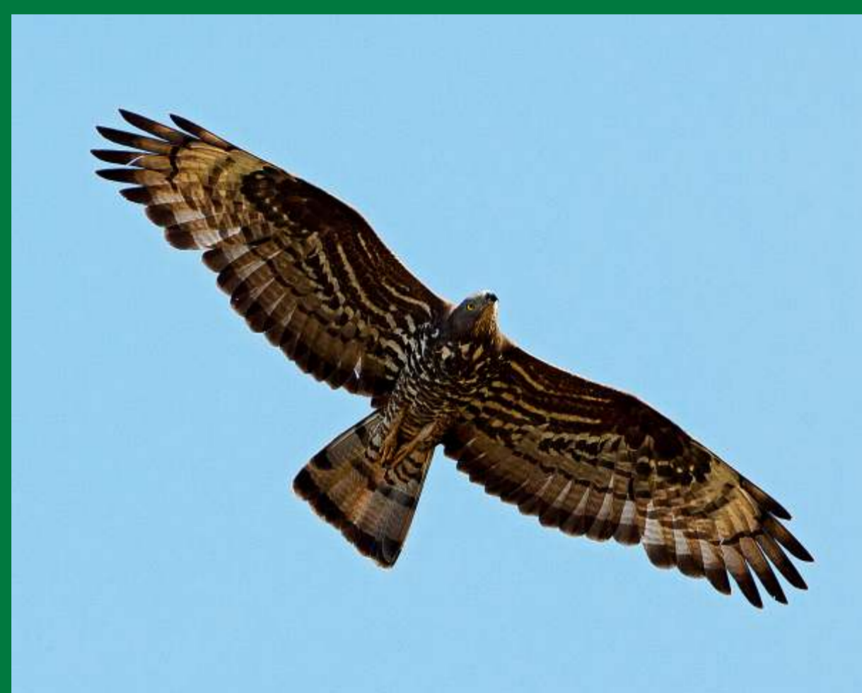
Včelojed lesní svou siluetou i zbarvením připomíná hojnější káň lesní.