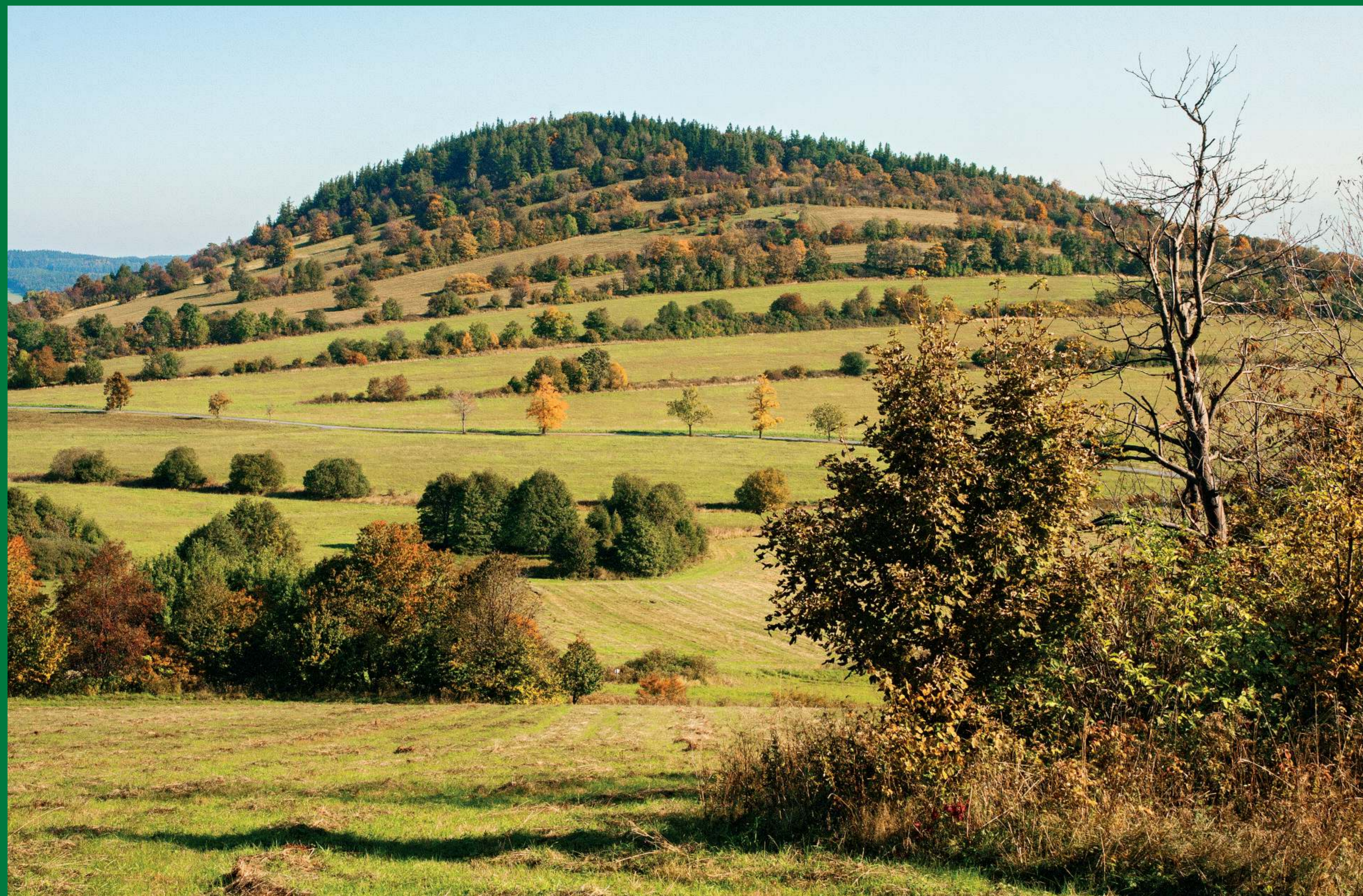
Velký Roudný je nejzachovalejší sopkou na Moravě.