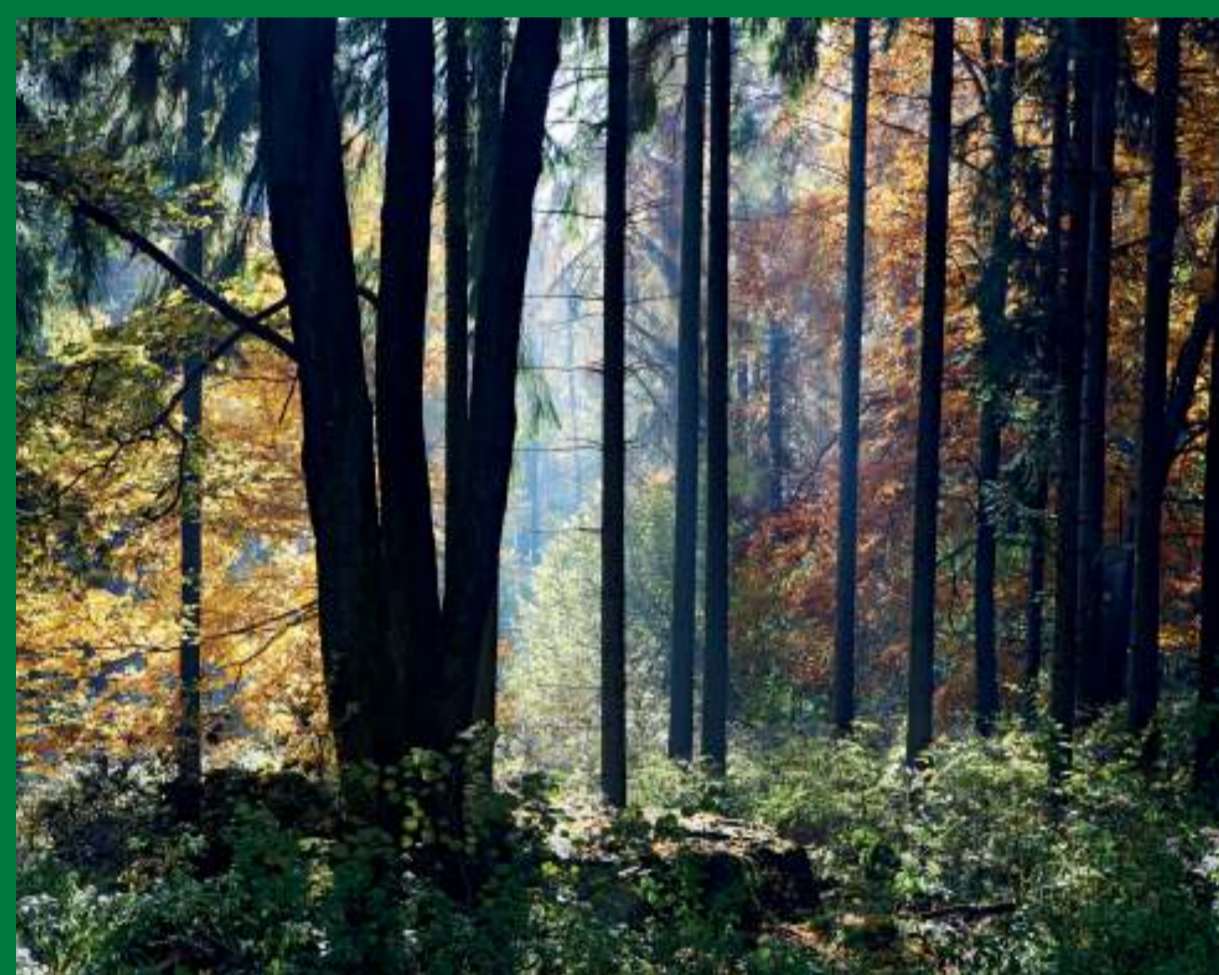
Vlivem člověka zde vznikl druhově bohatý les, ze kterého lze vyčíst obraz hospodaření v minulosti.