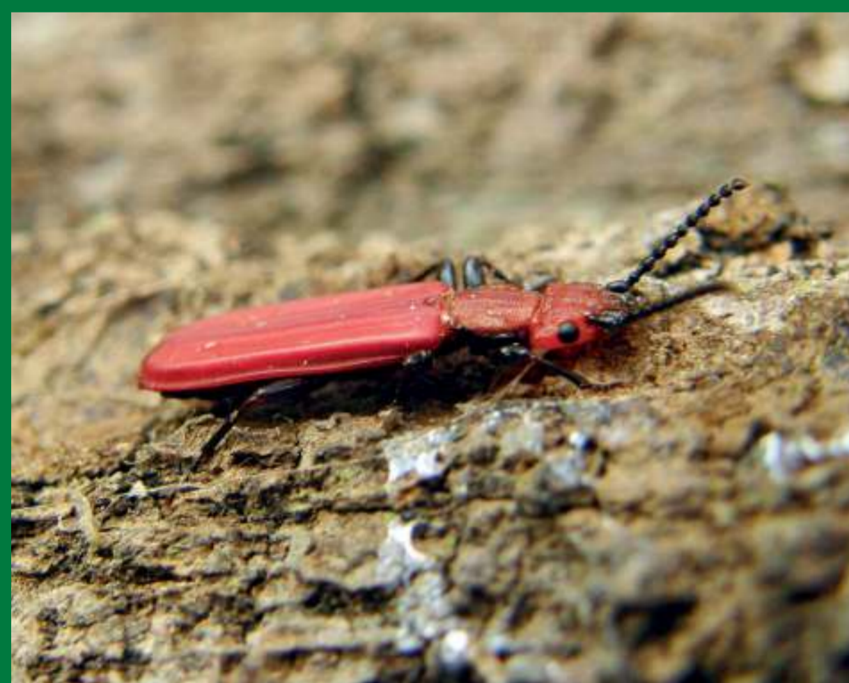
Lesák rumělkový je důkazem zachovalosti zdejších lesních porostů.