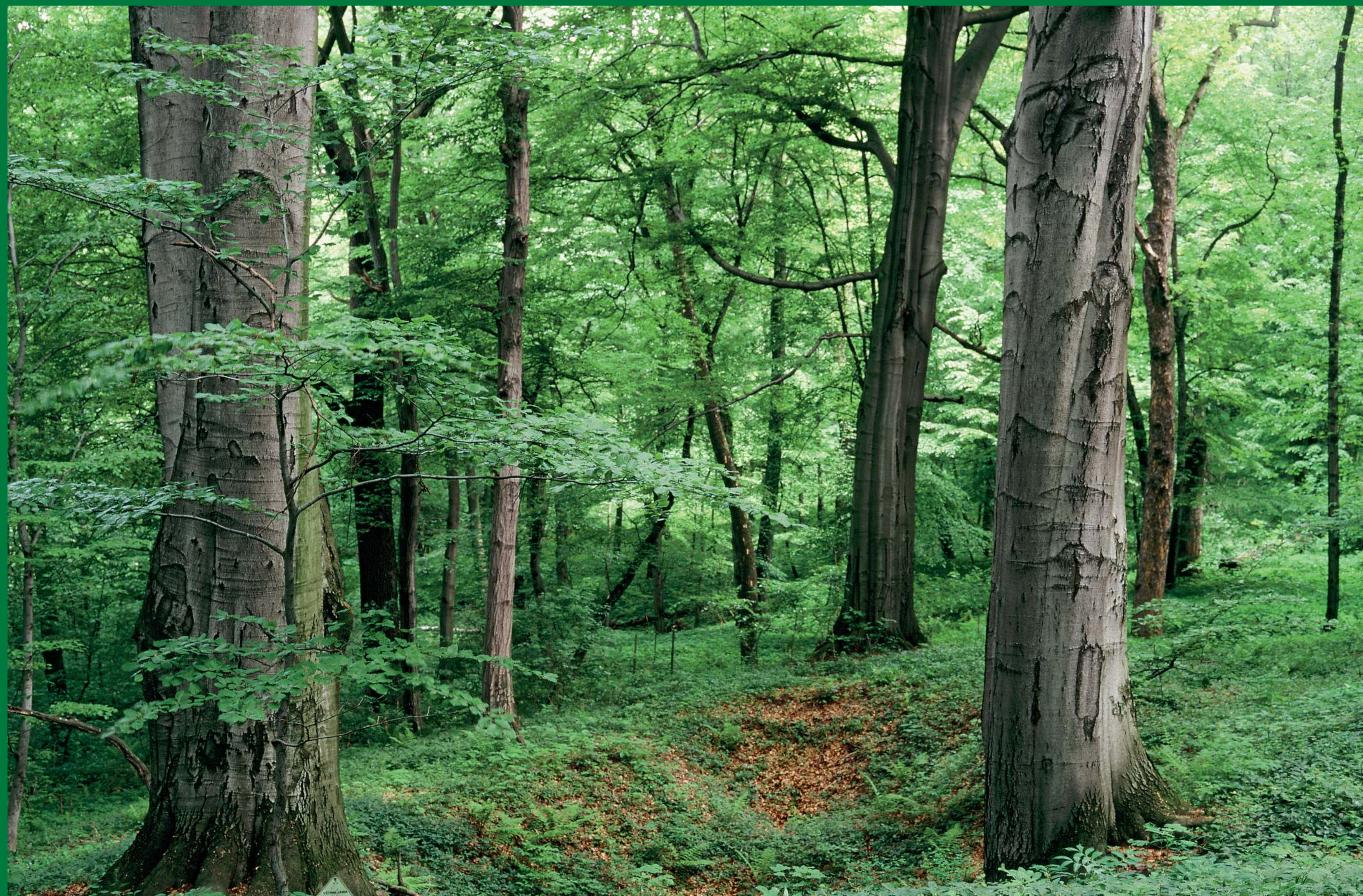
Lesu na Landeku dominují staré mohutné buky.