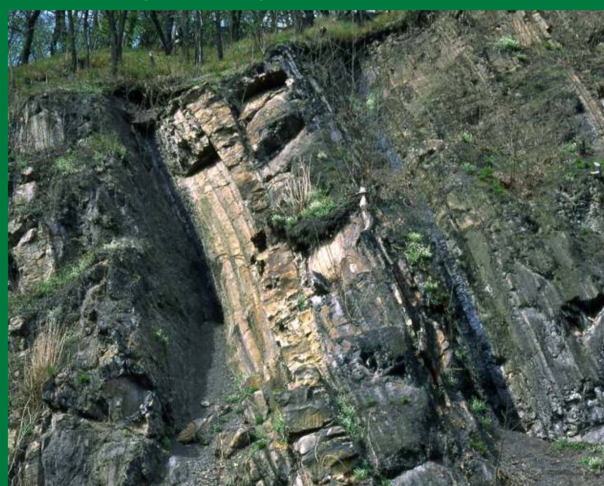
Na strmých svazích Landeka vystupují na povrch výchozy černého uhlí.